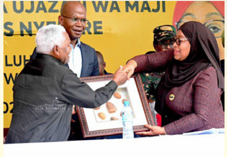
Rais wa Jamhuri ya Muungano wa Tanzania, Mhe. Samia Suluhu Hassan akiwapatia tuzo Marais Wastaafu, Mhe. Ali Hassan Mwinyi pamoja na Mhe. Dkt. Jakaya Kikwete kutokana na mchango wao katika utekezaji wa mradi wa umeme wa Julius Nyerere (JNHPP) ambao utazalisha megawati 2115.