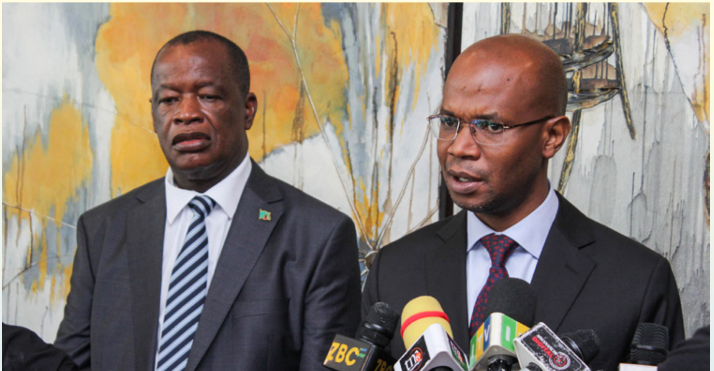
Waziri wa Nishati Mhe. January Makamba akizungumza na Waandishi wa Habari (hawamo pichani) baada ya kumaliza mkutano wa Tanzania na Zambia wa kujadili usalama wa bomba la mafuta la TAZAMA uliofanyika jijini Dar es Salaam tareh 6 Desemba 2022. Kushoto kwake ni Waziri wa Mambo ya Ndani wa Zambia, Mhe. Jack Mwiimbu.

Akizungumza katika kikao hicho kilichofanyika katika ukumbi wa Hyatt Regency Hotel jijini Dar es Salaam, Mhe. January Makamba ameeleza kuwa