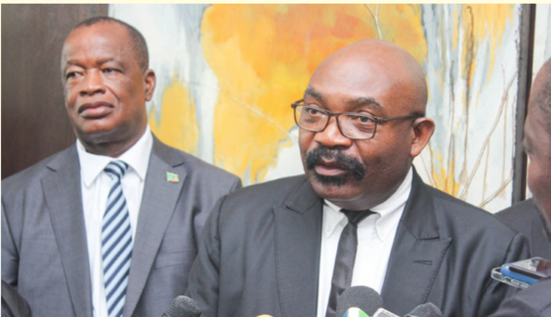
Waziri wa Ulinzi wa Zambia Mhe. Ambrose Lufuma akizungumza na Waandishi wa Habari (hawamo pichani) baada ya kumaliza mkutano wa Tanzania na Zambia wa kujadili usalama wa bomba la mafuta la TAZAMA uliofanyika jijini Dar es Salaam tarehe 6 Desemba 2022. Kushoto kwake ni Waziri wa Mambo ya Ndani wa Zambia, Mhe. Jack Mwiimbu.

Naye Waziri wa Ulinzi wa Zambia, Mhe. Ambrose Lufuma aliishukuru Serikali ya Tanzania kwa kuwa mwenyeji wa mkutano huo pamoja na timu ya ufundi kwa kufanya kazi nzuri ndani ya siku mbili walizokaa pamoja