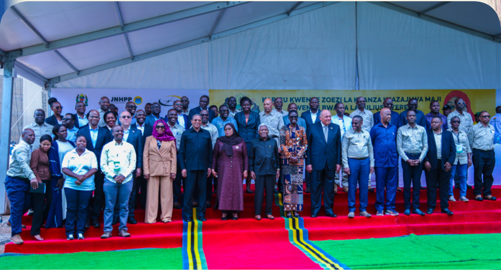
Rais wa Jamhuri ya Muungano wa Tanzania Mhe. Samia Suluhu Hassan akiwa katika picha ya pamoja na viongozi na watumishi wa Wizara ya Nishati, wakati wa zoezi la Kufunga Njia ya Kuchepusha Maji na Kuanza Ujazaji wa Maji kwenye Bwawa la Kuzalisha Umeme (Megawati 2115) la Julius Nyerere JNHPP kwenye Mto Rufiji Mkoani Pwani tarehe 22 Desemba, 2022.