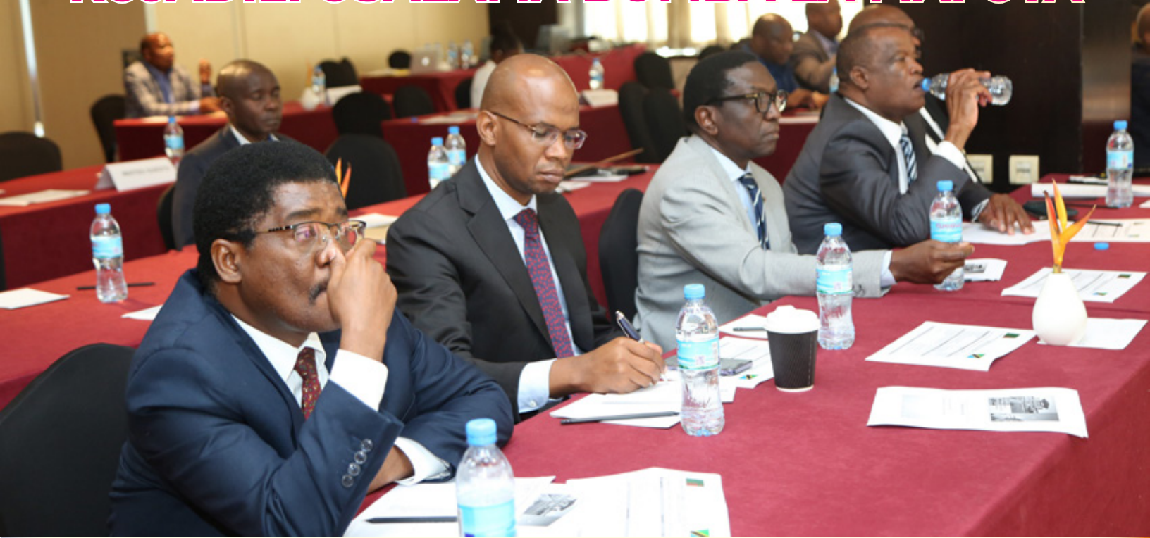
Mawaziri wa Tanzania na Zambia wakifuatilia mada kuhusu usalama wa bomba la mafuta wakati wa mkutano wa Tanzania na Zambia wa kujadili usalama wa bomba la mafuta la TAZAMA uliofanyika jijini Dar es Salaam tarehe 6 Desemba 2022.