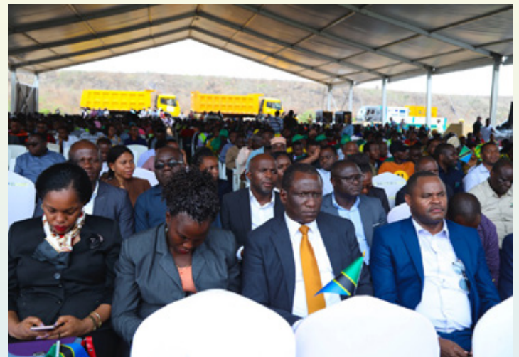
Baadhi ya Watumishi wa Wizara ya Nishati, wakimsikiliza Rais wa Jamhuri ya Muungano wa Tanzania Mhe. Samia Suluhu Hassan wakati wa zoezi la Kufunga Njia ya Kuchepusha Maji na Kuanza Ujazaji wa Maji kwenye Bwawa la Kuzalisha Umeme (Megawati 2115) la Julius Nyerere JNHPP kwenye Mto Rufiji Mkoani Pwani tarehe 22 Desemba, 2022.